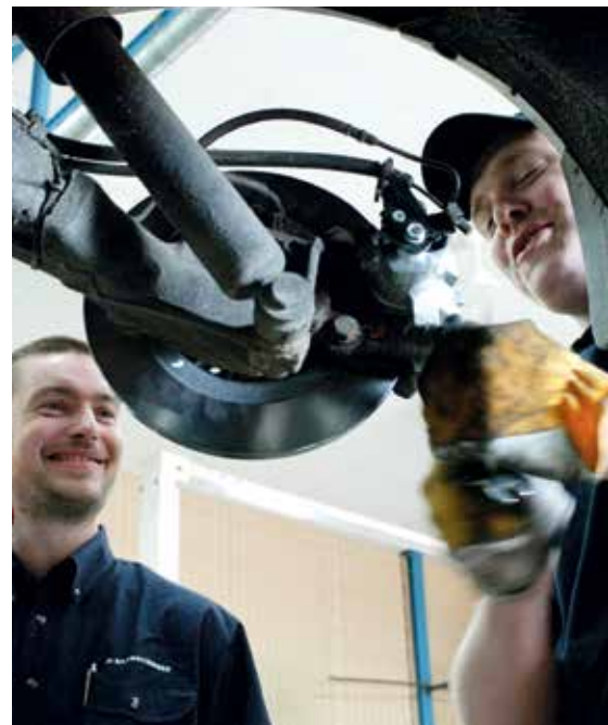
Nu har KBV och Laga inlett ett samarbete vilket gör att KBV-verkstäderna får tillgång till begagnade bildelar via Laga.

– Bilekonomin är en ganska tung bit för en vanlig konsument. Nu när tiderna är som de är, blir det ganska naturligt att man tittar på ett begagnat alternativ.